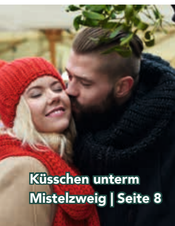
Küsschen unterm Mistelzweig | Seite 8