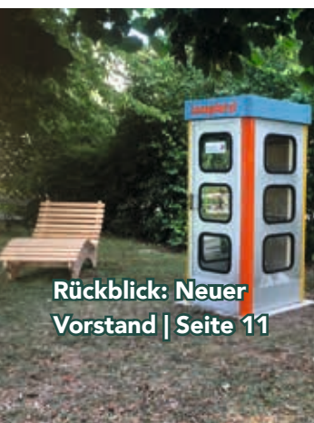
Rückblick: Neuer Vorstand | Seite 11