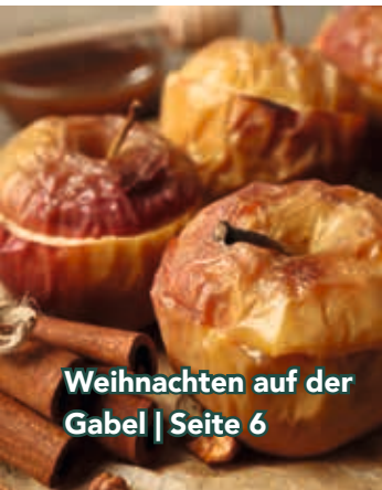
Weihnachten auf der Gabel | Seite 6