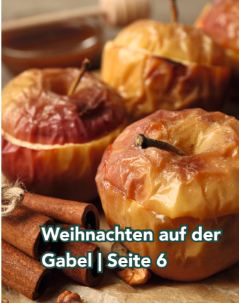
Weihnachten auf der Gabel | Seite 6