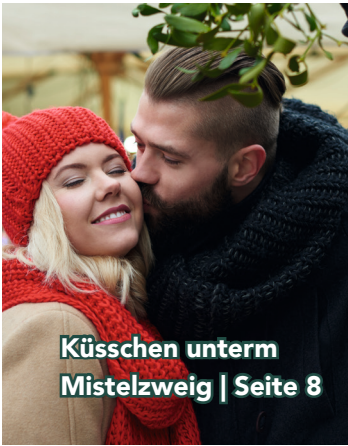
Küsschen unterm Mistelzweig | Seite 8