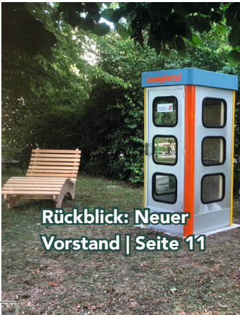
Rückblick: Neuer Vorstand | Seite 11