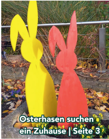
Osterehasen suchen ein Zuhause | Seite 3