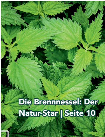
Die Brennnessel: Der Natur-Star | Seite 10