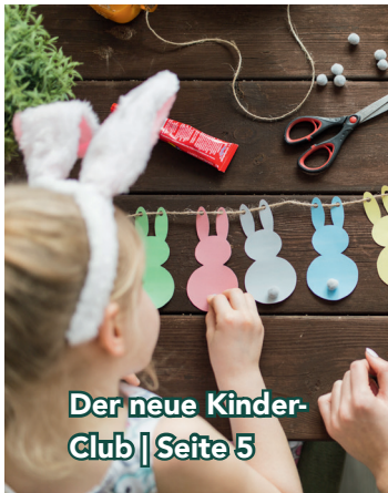
Der neue Kinder- Club | Seite 5